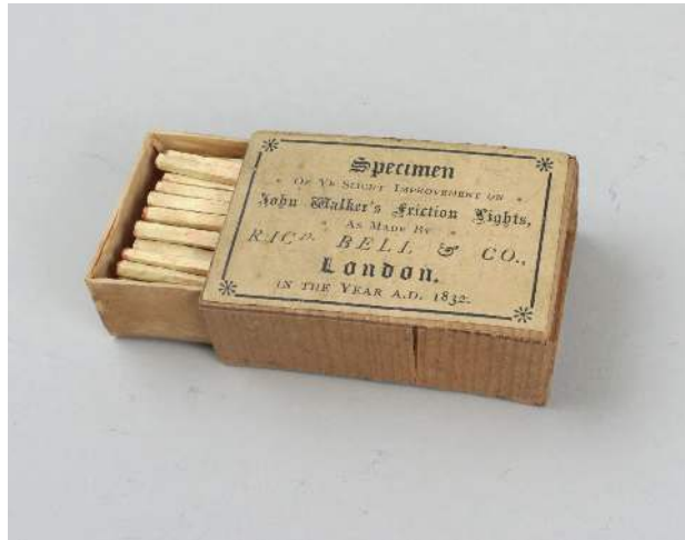
Figura 5: Las cerillas "Friction Lights"