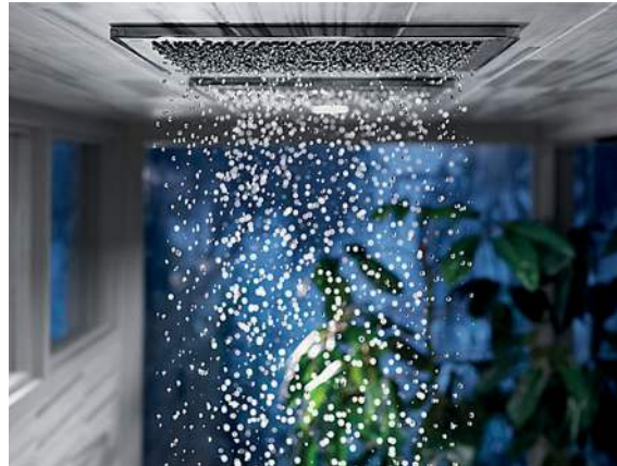
Figura 7: Ducha Kohler Real Rain

Estudiando todos los elementos de una ducha con lluvia natural, desde la variedad de tamaño de las gotas hasta los ángulos desde los que caen, Kohler ha creado Real Rain, una experiencia en la ducha que transporta al usuario más allá del evento diario. La lluvia suele ser un iniciador de conversaciones.