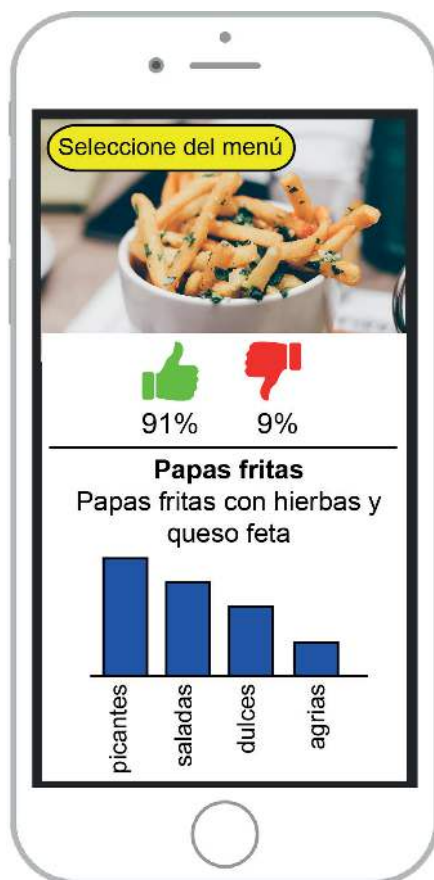
Figura 1: App Tasty